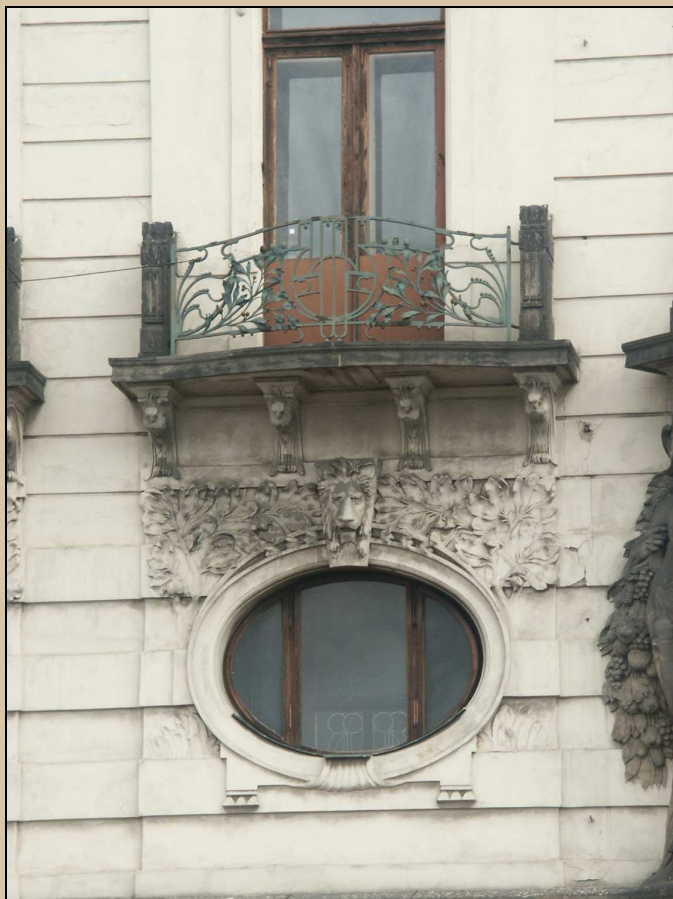
okno – celkový pohled z exteriéru