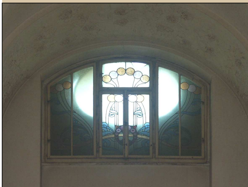
celkový pohled z interiéru