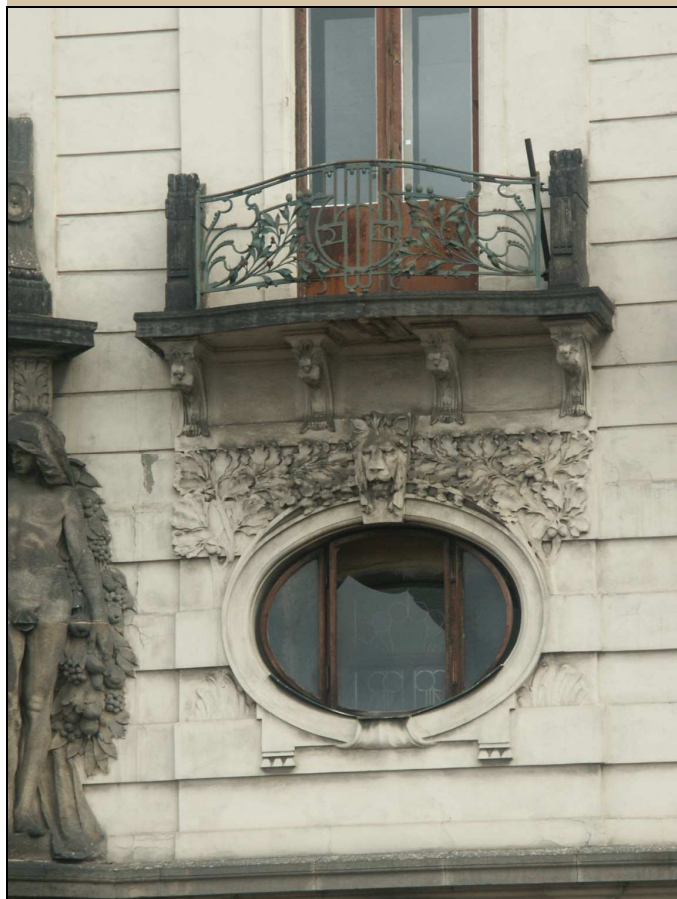
okno – celkový pohled z exteriéru

Po dokončení opravy rámu nechat restaurátorem zkontrolovat vitráž.