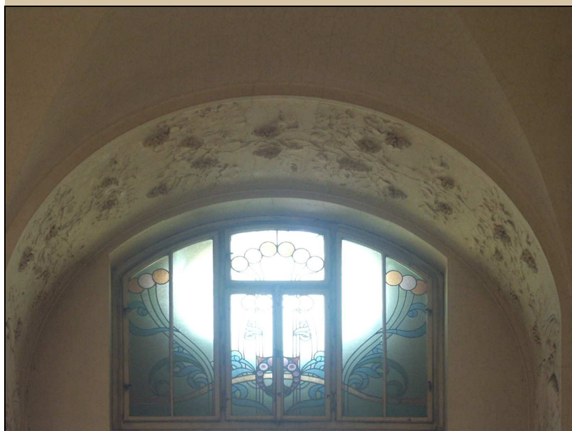
celkový pohled z interiéru